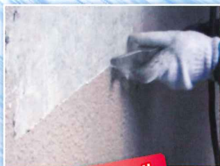
ショッピングモール 外壁塗膜剥離