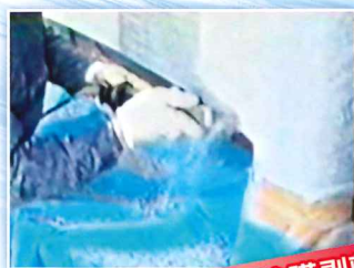
ホテル外壁塗膜剥離